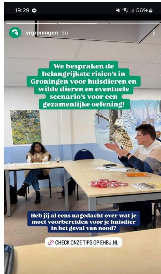
SDIR faciliteert de kennismaking tussen Veiligheidsregio en Dierenambulance in Groningen

Nederland is verdeeld in 25 veiligheidsregio's die verantwoordelijk zijn voor het organiseren van de crisisbeheersing in hun regio. Stichting Dieren in Rampen faciliteerde de eerste kennismakingsgesprekken tussen veiligheidsregio en dierenhulporganisaties in Groningen en Gelderland-Midden. Afspraken voor gesprekken werden gemaakt met de twee Limburgse regio's, Rotterdam-Rijnmond en Gelderland-Zuid. Eind 2024 waren we in gesprek met zeven regio's.