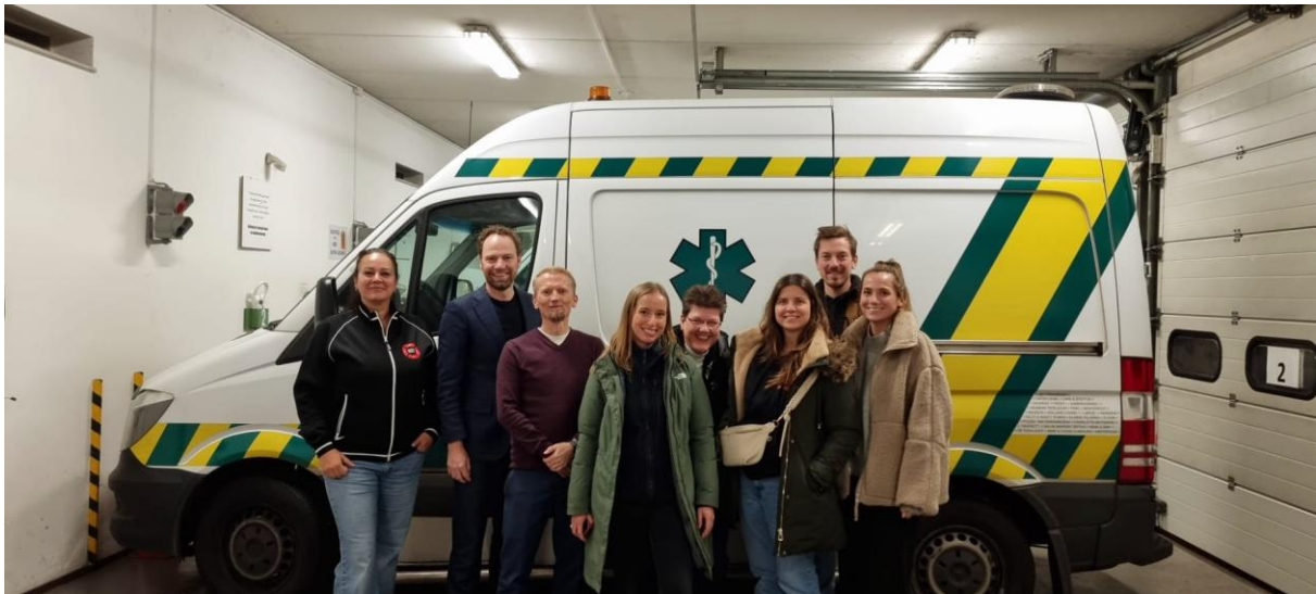
ADT bezoekt Dierenambulance Amsterdam