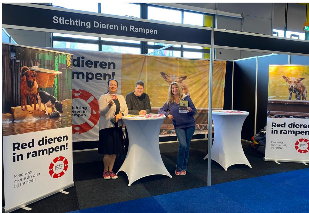
SDIR op eRIC 2024

De Geo Impact Stichting keurde de aanvraag van SDIR goed voor het bouwen van ARCGIS-toepassingen die kunnen helpen bij de coördinatie van dierenhulp bij rampen. In 2025 gaat Blue Intelligence dit systeem bouwen. Van ESRI hebben we gratis toegang gekregen tot ARCGIS Pro.