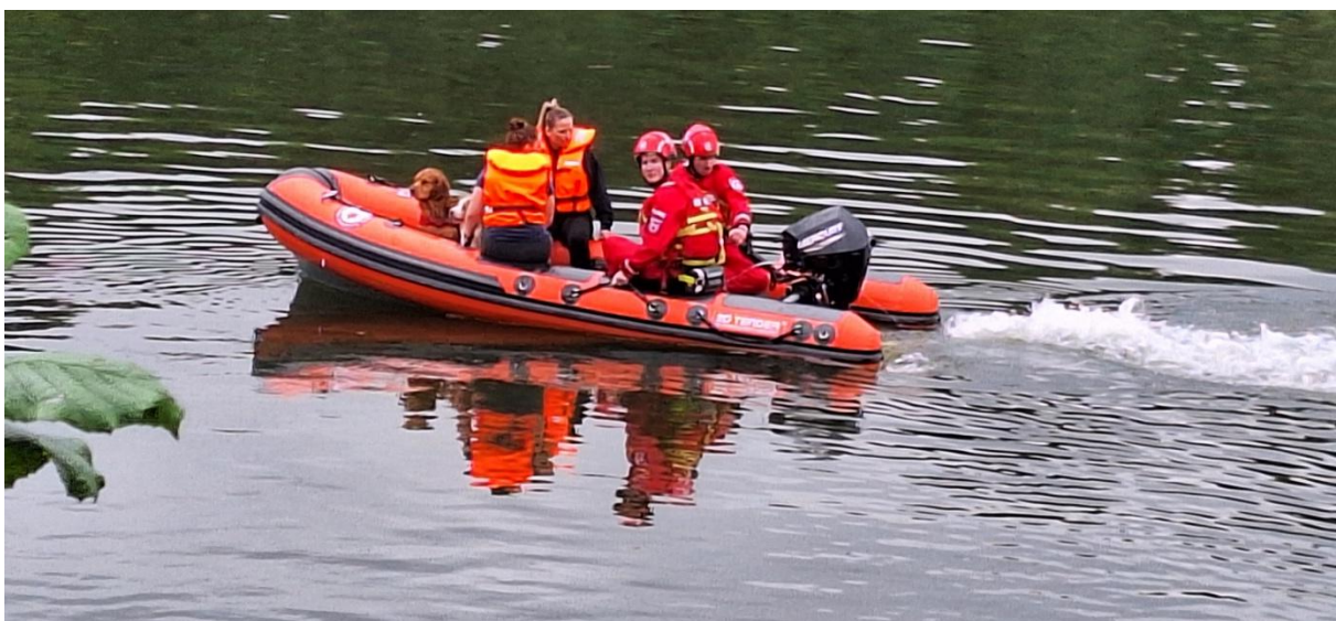
SDIR observeert een waterreddingstraining van ADT op de Maas in België