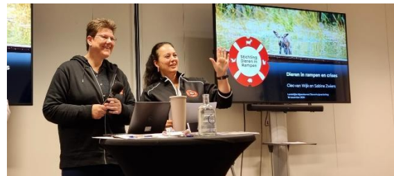
Presentatie SDIR bij landelijke dag voor dierenhulpverleners

Tijdens de halfjaarlijkse congressen Dierenhulpverlening van DierenLot ging SDIR in gesprek met dierenhulporganisaties, verzorgde presentaties en bemande een stand. Veel organisaties reageerden enthousiast en gaven aan graag mee te willen werken.