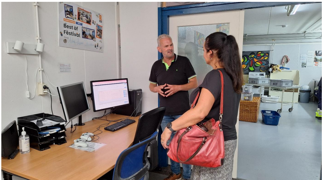
SDIR bezoekt Dierenambulance Groningen

Om dit te realiseren willen we dat dieren standaard worden opgenomen in noodhulpplannen. Samen met dierenambulances en dierenopvangen zetten we goed getrainde dierenhulpcrisisteam op die direct in actie kunnen komen bij een oproep vanuit de crisisbeheersing. We organiseren trainingen en oefeningen en ondersteunen lokale organisaties waar nodig. Bij grote rampen coördineert Stichting Dieren in Rampen de inzet voor dierenhulp.